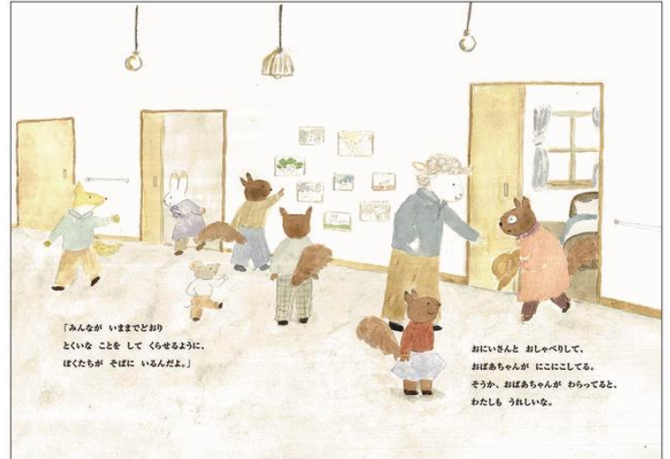
▲主人公の女の子とおばあちゃんは仲良し。 彼女はおばあちゃんの変化に気づき、戸惑いをおぼえます。