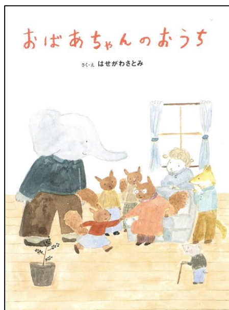
◀絵本『おばあちゃんの おうち』表紙

絵本『おばあちゃんの おうち』では、主人公の女の子が大好きなおばあちゃんとの関わりの中で、認知症のこと、グループホームでの暮らし、介護士の存在を知り、その重要性を理解していきます。主人公の女の子と一緒に、読者である子どもたち、保護者の方々が認知症介護の様子や大切さを知ることができる内容になっています。